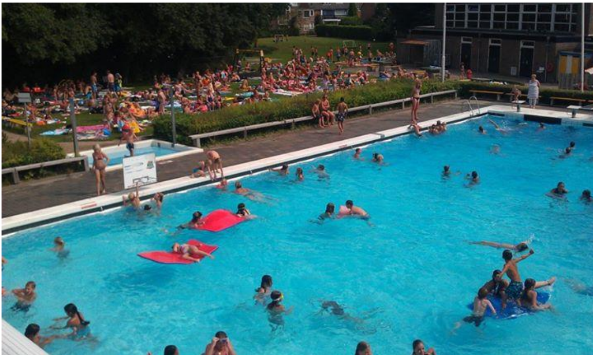
Veel gezellige drukte op een zonnige dag in het Puzzelbad.