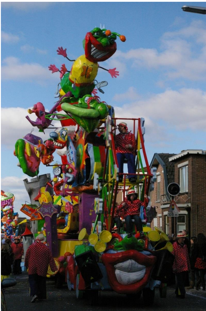
Carnavalsoptocht in Made: groot feest voor iedereen met veel creativiteit.