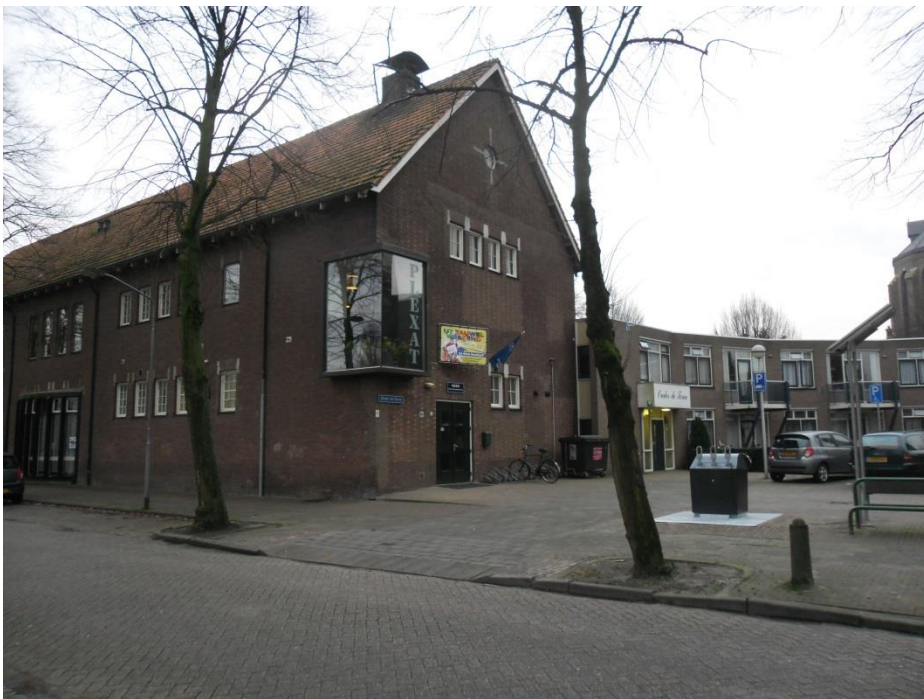
Plexat, het kloppend hart van Wagenberg.