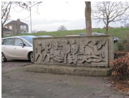
Oorlogsmonument Drimmelen "verstopt" bij parkeerplaats.