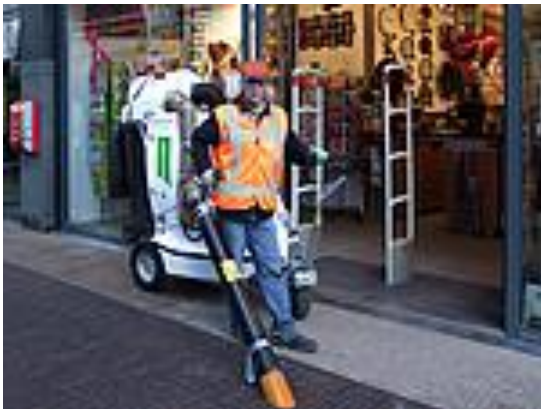
Met subsidie een schonere straat en meer werk.