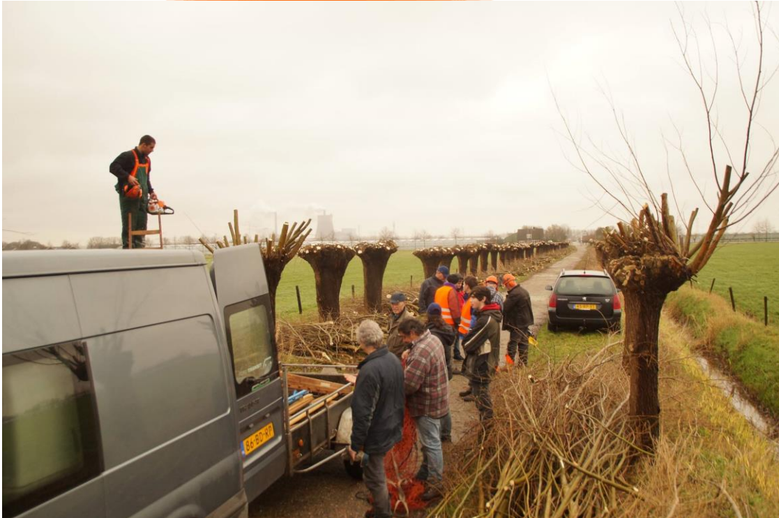
Het knotten van wilgen door de vrijwilligers van de Madese natuurvrienden ( Plukmadeseweg, Made)