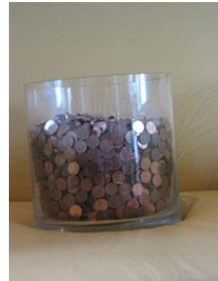
Onze pot met centen als onderdeel van de campagne, symbool voor investeren in Drimmelen.