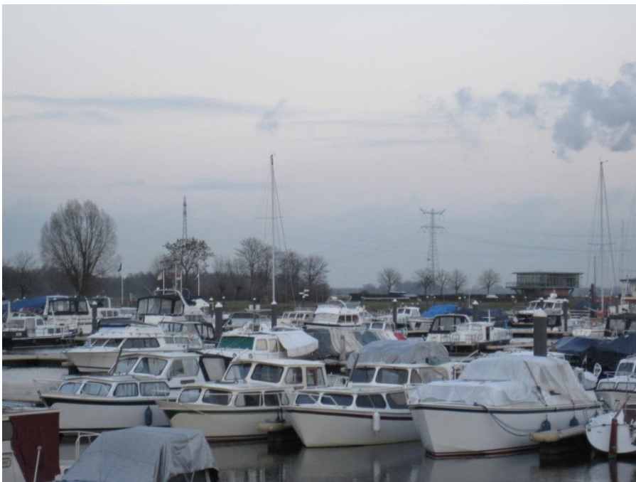
De nieuwe jachthaven Drimmelen als poort naar de Biesbosch.