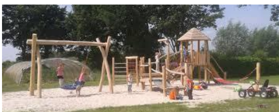
Spelen en kamperen bij de boer.