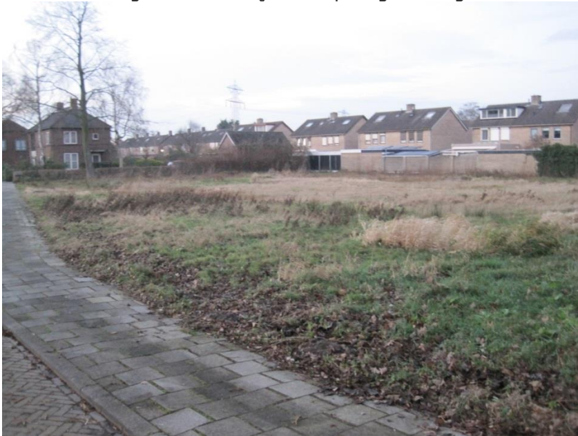
Braakliggend terrein aan de Julianastraat in Hooge Zwaluwe. Voorkeur woningbouw, tijdelijk alternatief schooltuintjes.

De bestemmingsplannen van de kernen zijn bijna allemaal op orde en er zijn veel overbodige regels en procedures geschrapt. In het bestemmingsplan buitengebied is, om verpaupering tegen te gaan en een daadwerkelijk impuls te geven aan toerisme en recreatie een verruiming van de regels noodzakelijk. Wij zien bijvoorbeeld de boekenhandel in Helkant, de organisatie van activiteiten aan Wagenstraat te Wagenberg en de bouw van carnavalswagens in het overgangsgebied als verrijking van onze maatschappij. Ook (startende) bedrijven moeten bij een landschappelijke en milieuhygiënische inpasbaarheid niet beperkt worden in hun ontwikkelingen. Primair blijft het open agrarisch gebied bestemd voor de landbouw!