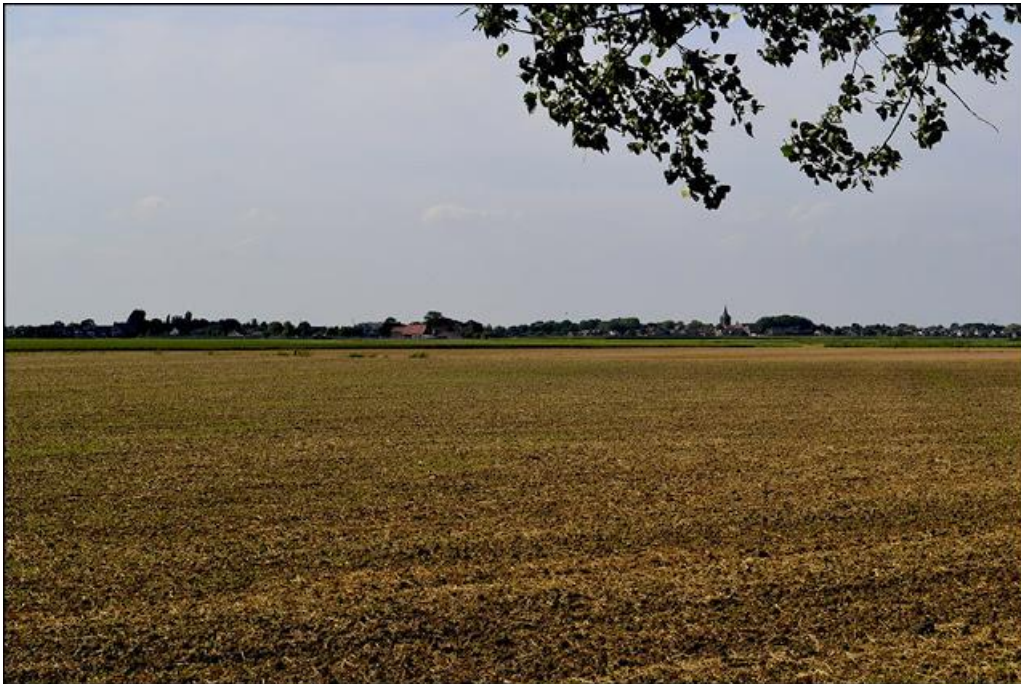
Behoud open landschap (Zwaluwse polder).